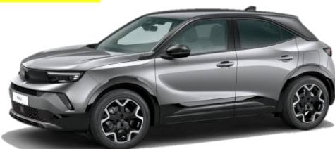
Šedá Kontrast (F4M0) 550 €