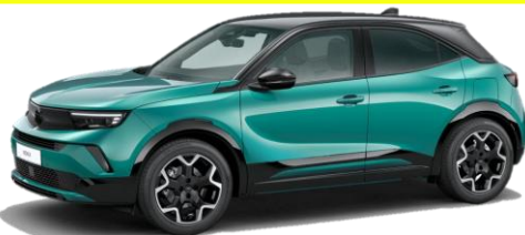
ZelenáTropikal (YQM0) 550 €