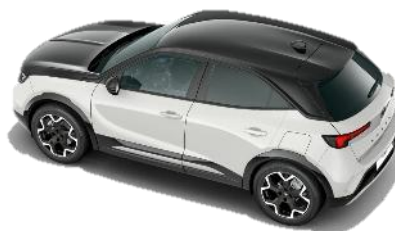
Čierna strecha Karbon (JD20) 500 € / GS štandard Čierna kapota Karbon Black (7N02) – GS 350 €