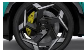
20" disky z ľahkých zliatin BiColor s 5 lúčmi (ZH0N)