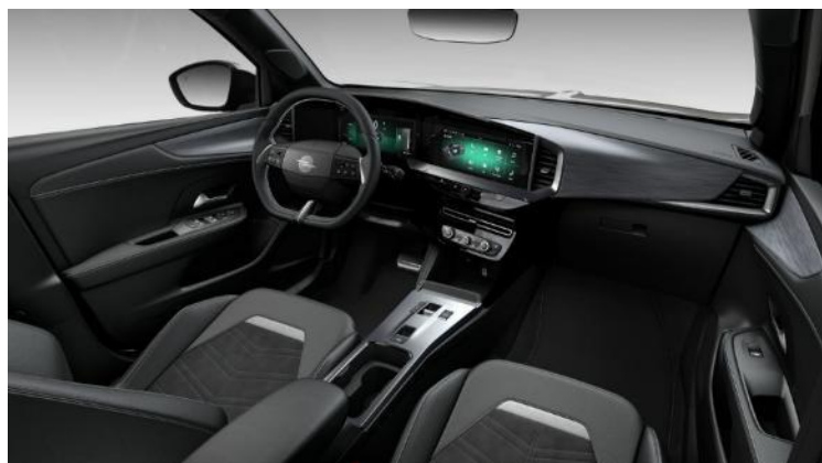
Čalúnenie čierne velúrové „ReNewKnit“ z recyklovaného materiálu, komfortné sedadlo vodiča s masážnou funkciou, GS/Ultimate – 750 €