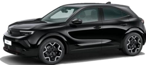
Čierna Karbon (9VM0) 550 €