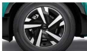
16" oceľové disky s dvojfarebnými krytmi (ZHR5)