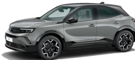
Šedá Grafik (SDP0) 550 €