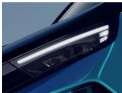
Intelli-Lux LED® pixelové svetlomety

Opel Pure Panel® plne digitálny 10" displej