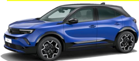
Modrá Kolibri (6ZM0) 0 €