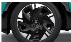
18" disky z ľahkých zliatin BiColor s 5 lúčmi (ZHRT)