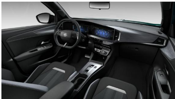
Čalúnenie čierne kombinácia látka/Premium imitácia kože „Fokus“, ozdobné lišty v kovovom vzhľade a čierne kožené vložky dverí (EHFX) – GS – 0 €