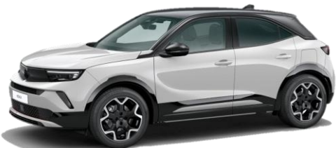
Biela Arktis (WPP0) 400 €