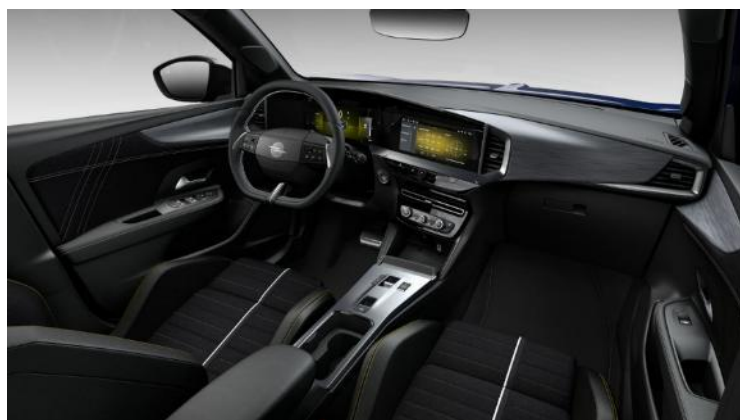
GSE športové sedadlá, čalúnenie čierne vegan velúr-koža Alcantara™ Performance, čierne vložky dverí Alcantara, GSE – 0 €