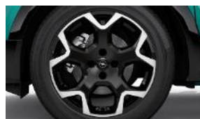
18" disky z ľahkých zliatin BiColor s 5 lúčmi (ZHQ1)