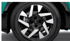
17" disky z ľahkých zliatin BiColor s 5 dvojitými lúčmi (ZHT9/ZHP8)